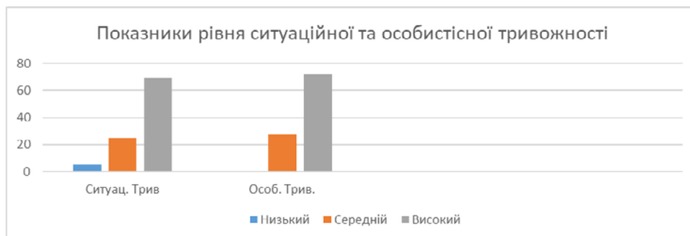
Рис.1. Рівні ситуативної та особистісної тривожності за методикою Ч.Спілбергера (розроблено автором)

Аналіз фактичних даних, отриманих за тестом Ч. Спілбергера, показав, що переважна більшість опитаних мають високий рівень ситуативної (69,4%) та особистісної (72,2%) тривожності, при цьому рівень тривожності двох респондентів знаходиться на межі тривожного розладу. 25% респондентів мають середній рівень ситуативної тривожності та 27,7% – середній рівень особистісної, і лише 5,5% опитаних мають низький рівень ситуативної тривожності. При цьому не було виявлено жодного респондента з низьким рівнем особистісної тривожності (рис. 1). Ці невтішні результати вказують на те, що студенти магістратури, майбутні психологи є досить тривожними сьогодні, у період війни і введення воєнного стану в Україні.