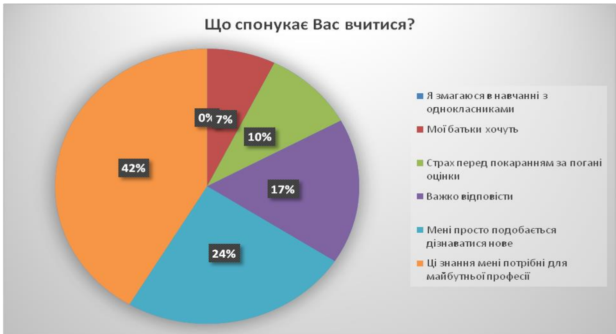
Рис.2. Чинники мотивації до успішного навчання