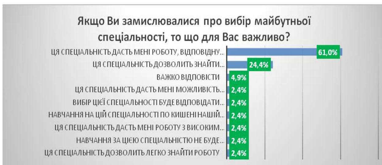
Рис.8 Чинники вибору майбутньої спеціальності

Для більшості опитаних важливо, що обрана професія дасть змогу отримати роботу, відповідну їх власним інтересам і схильностям (61%); високооплачувана робота мотивує до вибору певної професії (24,4%) опитаних, по 2,4 % школярів вказали і на такі чинники вибору, престиж професії, можливість швидкого працевлаштування (легко знайти роботу), легкість навчання, побажання батьків, а 5% не мають відповіді на це питання (Рис.8).