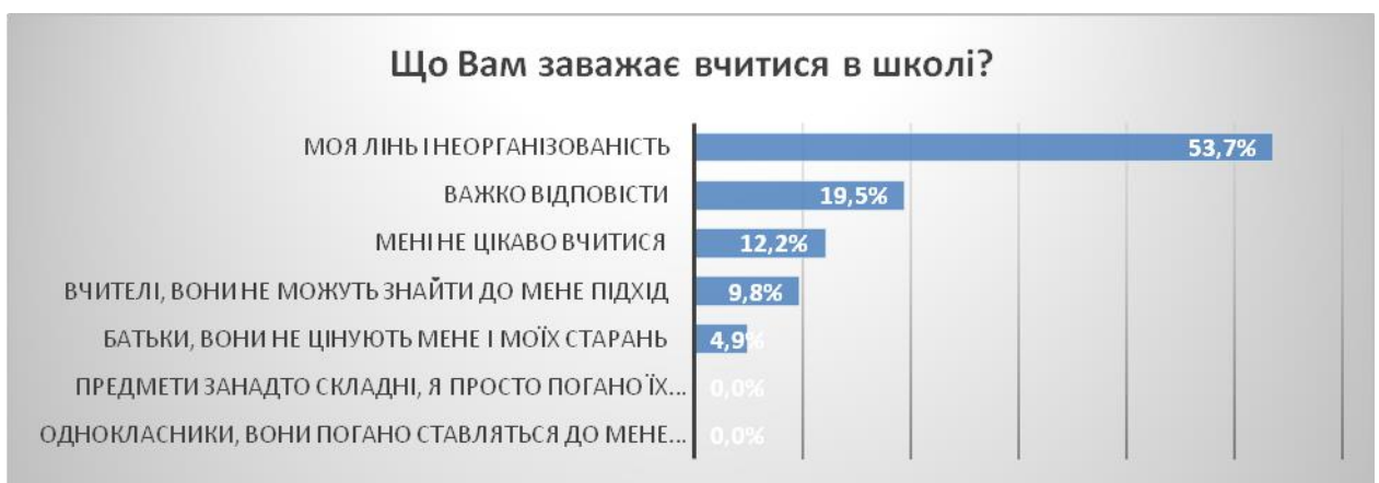
Рис.3. Чинники перешкод успішному навчанню

Вчителів, яким важко знайти підхід до учня, причиною шкільних негараздів вважає майже кожен десятий респондент (9,8%). Батьків, які не цінують школярських старань, чи не стимулюють їх, вважають завадою власним успіхам (4,8%) (Рис.3)