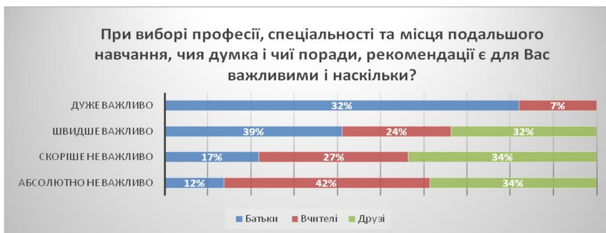
Рис.7. Роль оточення в виборі майбутньої професії

Схожа ситуація з урахуванням думки друзів – їх підказок не потребує більше двох третин школярів (Скоріше не важлива (34,1%), Абсолютно не важливо – (34,1%)) (Рис.7).