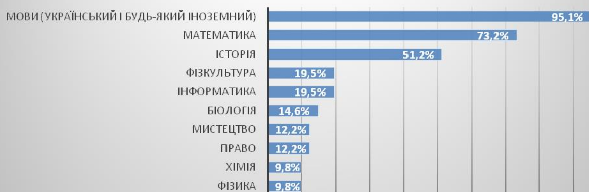
Рис.5. Пріоритети у предметах шкільної програми