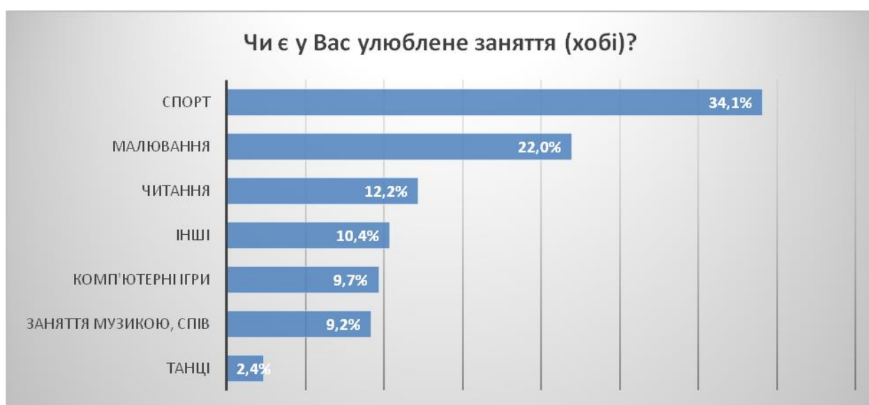
Рис.4. Зміст занять на дозвіллі

Кожен п'ятий респондент (близько 20%) вказав і на якесь інше конкретне заняття (малювання, мистецтво, заняття музикою, танці, вишивання, в'язання, перегляд фільмів, колекціонування, вивчення мов, кулінарія, віршування, фітнес тощо) (Рис.4).