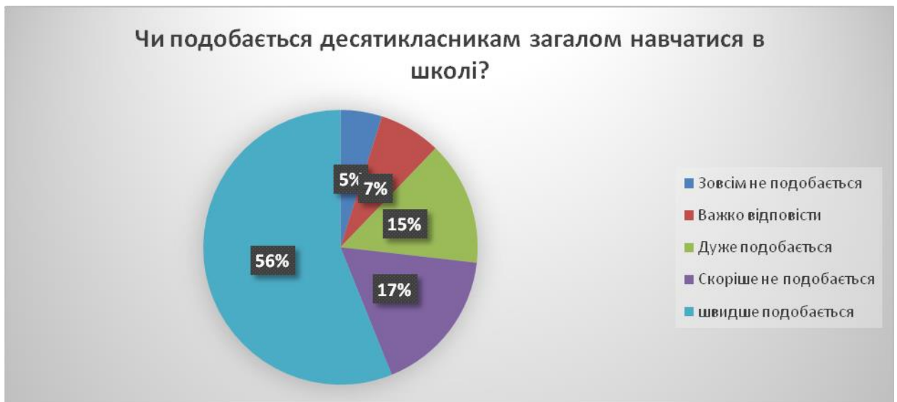
Рис.1. Ставлення десятикласників до навчання в школі

Переважна більшість(70,1%) ставиться до навчання позитивно, до негативної відповіді схиляється більше ніж п'ята частина опитаних школярів(22%), коливається з відповіддю 7,3 % опитаних(Рис.1).