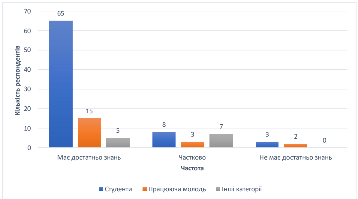
Рисунок 2.3. Розподіл знань про контрацепцію за соціальним статусом