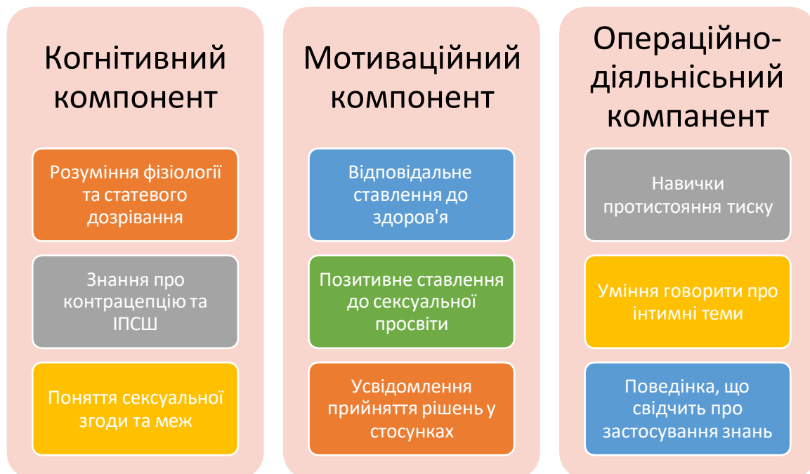
Рисунок 3.1. Компоненти сексуальної обізнаності.

З метою виявлення результативності впровадженої Програми розвитку сексуальної обізнаності було здійснено кількісне порівняння рівнів сформованості когнітивного, мотиваційного та операційно-діяльнісного компонентів до початку та після завершення формувального етапу.