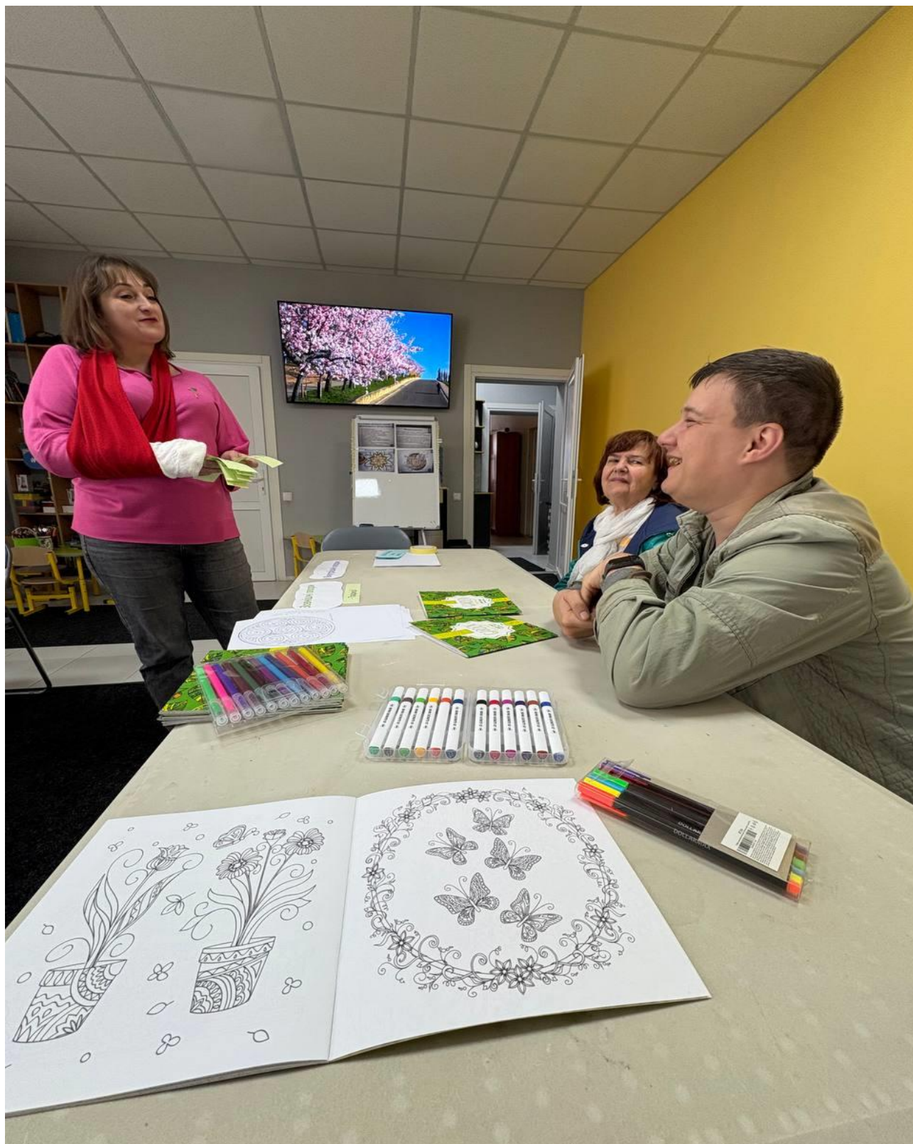
Фото звіт про проведення тренінгів з формування відповідального батьківства з учнями Смілянського мистецького ліцею «Успіх» Чуркаської обласної ради