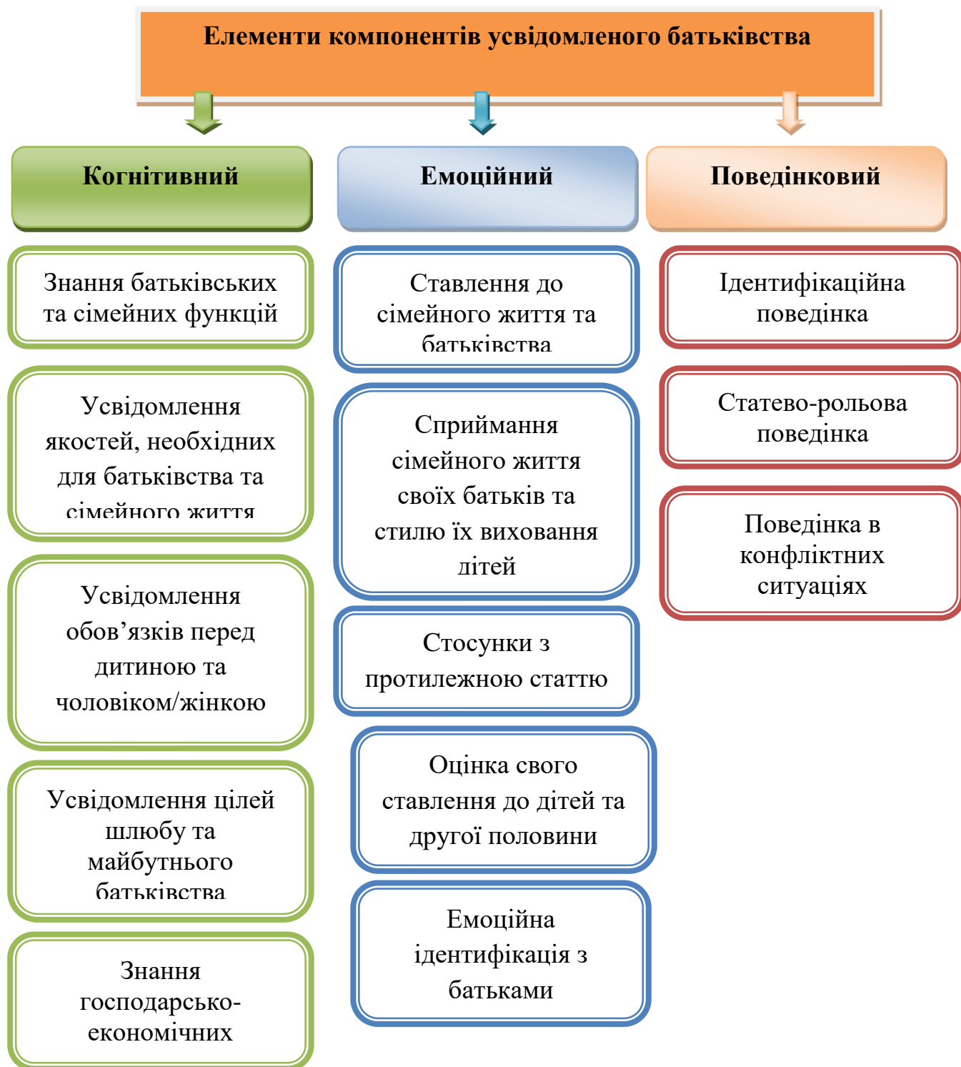
Рис. 1.1. Аспекти психологічних форм прояву усвідомленого батьківства

Взаємодія складових усвідомленого батьківства відбувається завдяки їхній взаємозалежності у когнітивному, емоційному та поведінковому вимірах, що постають основними психологічними формами його прояву. (рис. 1.1).