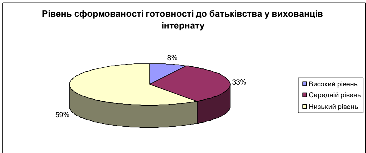
Рис. 2.2. Рівень сформованості готовності до батьківства у вихованців інтернату

Результати емпіричного дослідження засвідчили наявність суттєвих відмінностей у рівнях сформованості психологічної готовності до усвідомленого батьківства між підлітками, які виховуються в сім'ях, та вихованцями інтернатних закладів. У більшості дітей із сімей переважає середній рівень готовності, тоді як серед вихованців інтернатів домінує низький рівень сформованості відповідальності, емоційної зрілості та усвідомлення змісту батьківських функцій. Це свідчить про значний вплив сімейного середовища на формування уявлень про батьківство, рольові моделі та ціннісні орієнтації, пов'язані із сімейним життям.