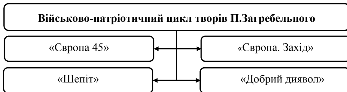
Рис. 2. Військово-патріотичний цикл творів П. Загребельного

Якщо ділити твори П. Загребельного за циклами, то схемографічно військово-патріотичний цикл творів письменника можна подати у такому вигляді (рис. 2):