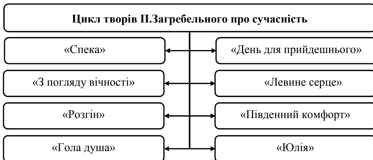
Рис. 4. Художні твори П. Загребельного на тему сучасності

Особливою популярністю серед читачів користуються твори П. Загребельного на тему сучасності. Така тематика дуже близька сучасній молоді та викликає розуміння певних дій та подій з боку звичайної людини (рис. 4).