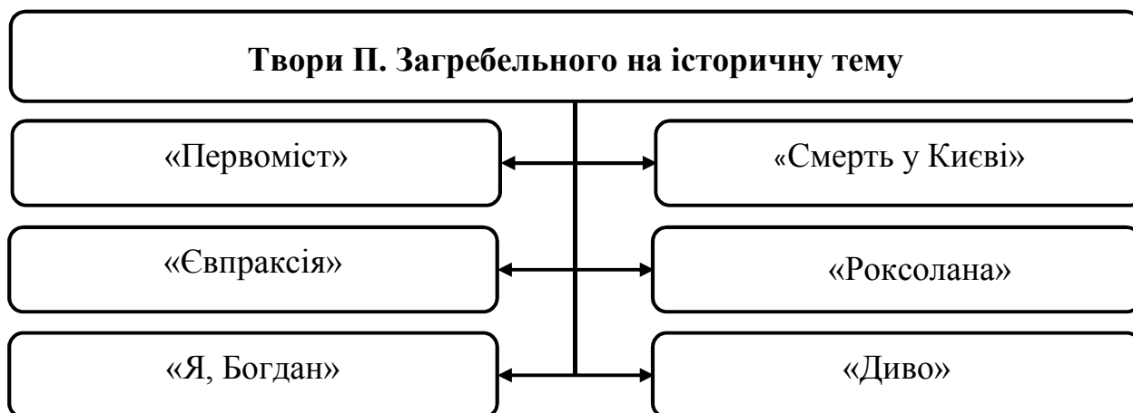
Рис. 4. Художні твори П. Загребельного на історичну тематику

Особливою популярністю серед читачів користуються твори П. Загребельного на тему сучасності. Така тематика дуже близька сучасній молоді та викликає розуміння певних дій та подій з боку звичайної людини (рис. 4).