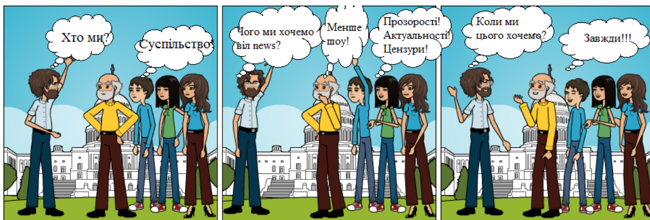
Рис. 2. Результат створення коміксу за допомогою онлайн-сервісу «Pixton» за умовами вправи «Хто формує порядок денний у ЗМІ?»

Pixton – ( http://www.pixton.com ) – сервіс, що дозволяє додавати персонажів з бази, змінювати їх та складати історії. Дидактичний потенціал коміксів відображається у можливості створення коміксів самими учасникам, завдяки чому може відбуватися глибоке засвоєння подій, ситуацій від імені яких учасники вибудовують діалоги та створюють візуалізацію обставин. Комікси сприяють розвитку візуальної грамотності через відображення реальної або історичної дійсності. Прикладом такого завдання може слугувати розробка коміксу за допомогою сервісу Pixton під час виконання вправи «Хто формує порядок денний у ЗМІ?» (рис. 2).