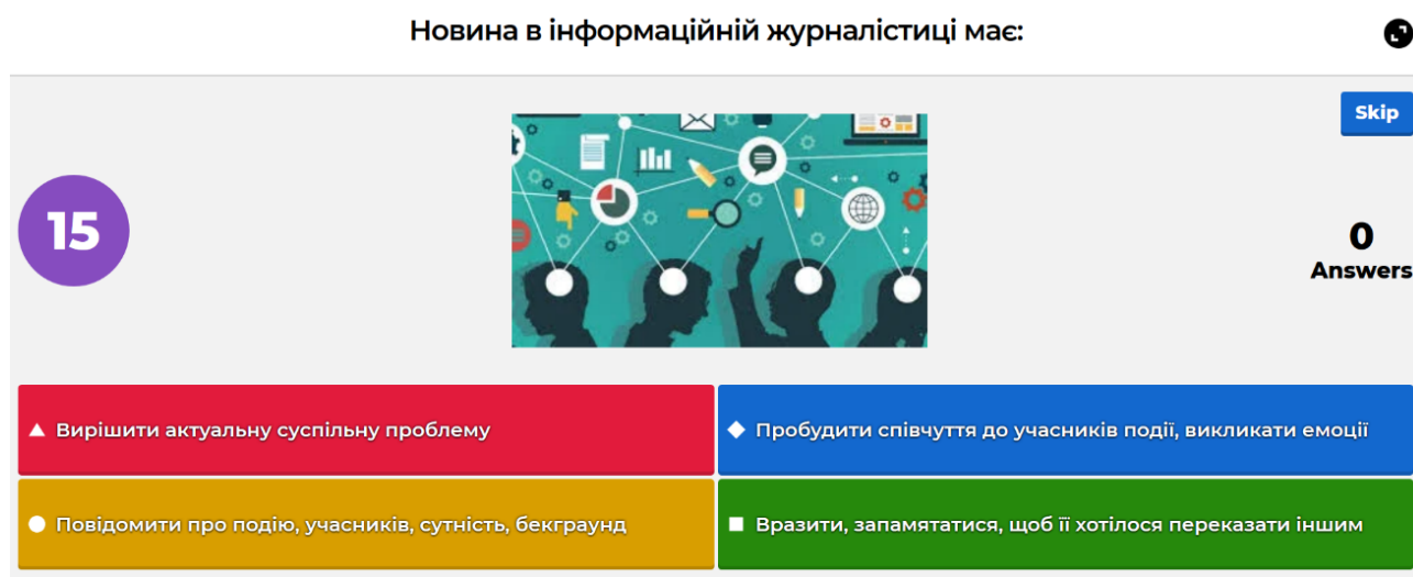
Рис. 3. Фрагмент вікторини у середовищі онлайн-засобу «Kahoot»

Використання цього сервісу на заняттях з медіаграмотності має на меті створення цікавих вікторин для майбутніх магістрів освіти. Фрагмент вікторини представлено на рис. 3: