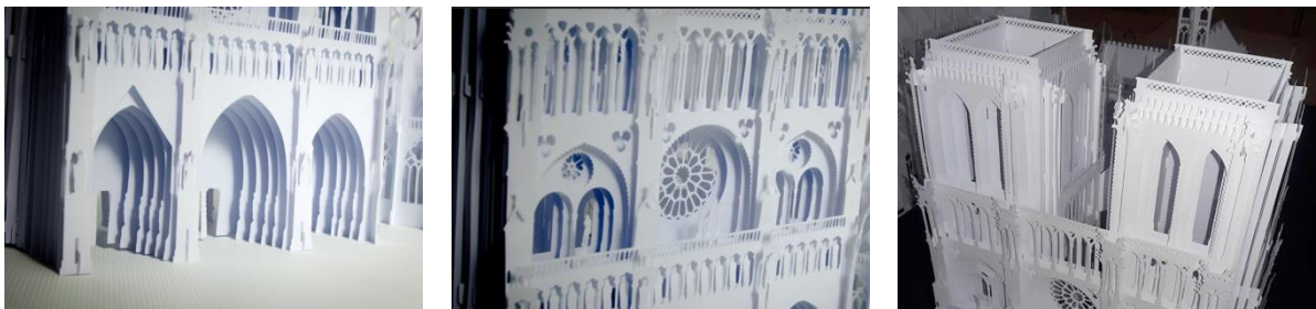
Рис. 2. Реалізація у слайс-моделі архітектурного орігамі Нотр-Дам західного фасаду

самперед, це три монументальні стрілчасті портали при вході: портал Страшного суду (центральний), портал Богоматері (ліворуч) і портал Святої Анни (праворуч). Над трьома порталами розташувалася галерея королів — вирізані з паперу силуети статуй, що зображують царів Юдеї. Вище, над галереєю королів розташувалася балюстрада, за якою, власне, розмістився круглий вітраж «Велика троянда». Вона містить два кола з пелюстками (в малому 12 пелюсток, у великому — 24), укладені в квадрат, який, в свою чергу, символізує єдність божественної нескінченності і матеріального світу людей. Троянда знаходиться за статуєю Діви Марії з малим Ісусом, з обох боків котрої вирізані з паперу силуети статуй Адама і Єви. Угорі Західного фасаду собору розмістилися дві вежі — Північна й Південна.