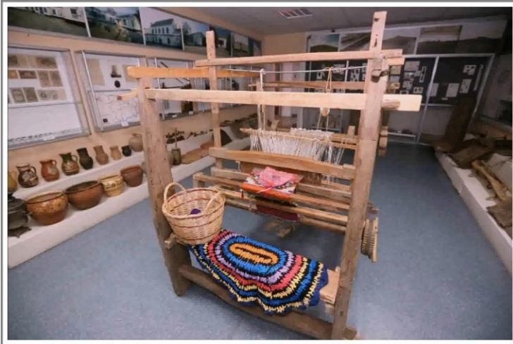
Рис. 1. Діючий ткацький станок в краєзнавчому музеї с. Гусарка [8]

Комунальний заклад «Більмацький районний краєзнавчий музей ім. М.Я. Гудини» Більмацької районної ради, який знаходиться в селі Гусарка, є зберігачем традицій ткацтва. В музеї налічується близько 40 ткацьких виробів та 90 експонатів ткацтва. Це вироби місцевих майстринь, ткацькі інструменти, два діючих ткацьких верстата та інше (рис. 1-2).