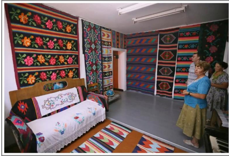
Рис. 2. Експозиція красназавчого музею з роботами гусарківських майстринь [8]

Експонати музею є гарним матеріалом для розвитку туризму на об'єктах нематеріальної культурної спадщини Запорізького краю і є яскравим прикладом для національно-патріотичного виховання молоді. В туризмі відвідування об'єктів НКС проявляється у формуванні ціннісного відношення до культури свого та інших народів (особливо, які живуть в багатонаціональній державі), артефактах культурної діяльності, архітектурі, живопису і т. ін., розширюється коло справжніх цінностей, підвищується свідомість, стимулюється самовиховання, саморозвиток. Базовими компонентами виховання засобами туризму з використанням об'єктів НКС є: виховання духовної особистості; потреба в їх пізнанні та спілкуванні з ними; потреба у перетворюючій діяльності; сприйняття навколишнього світу; благотворний вплив культурного середовища; залучення населення до здорового способу життя, сукупності фізичного і духовно-морального виховання [1, с. 23].