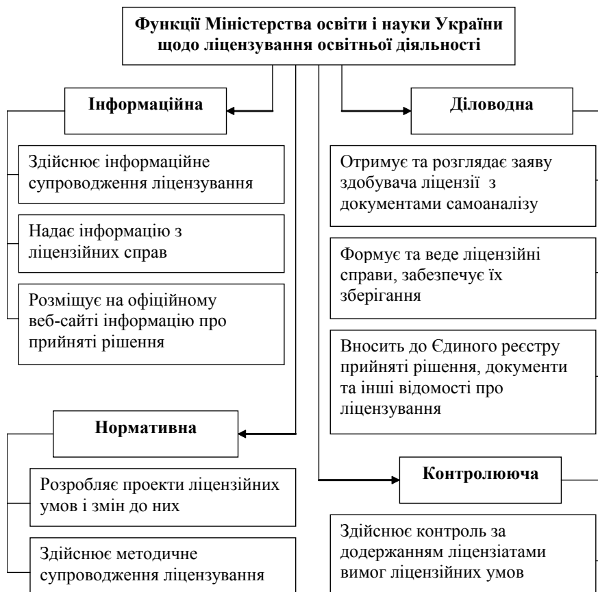
Рис. 2. Функції та повноваження МОН щодо ліцензування освітньої діяльності