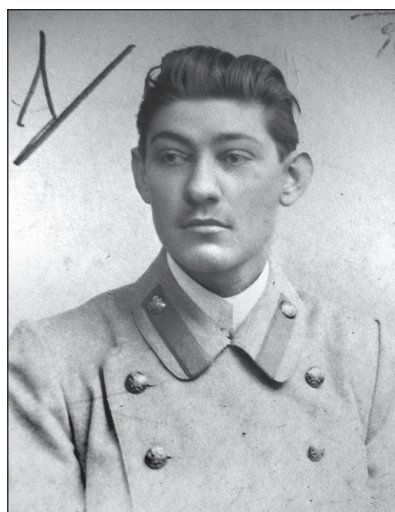
Д. І. Донцов у новенькій університетській формі. С-Петербург, 1902 рік. [1, арк.1]