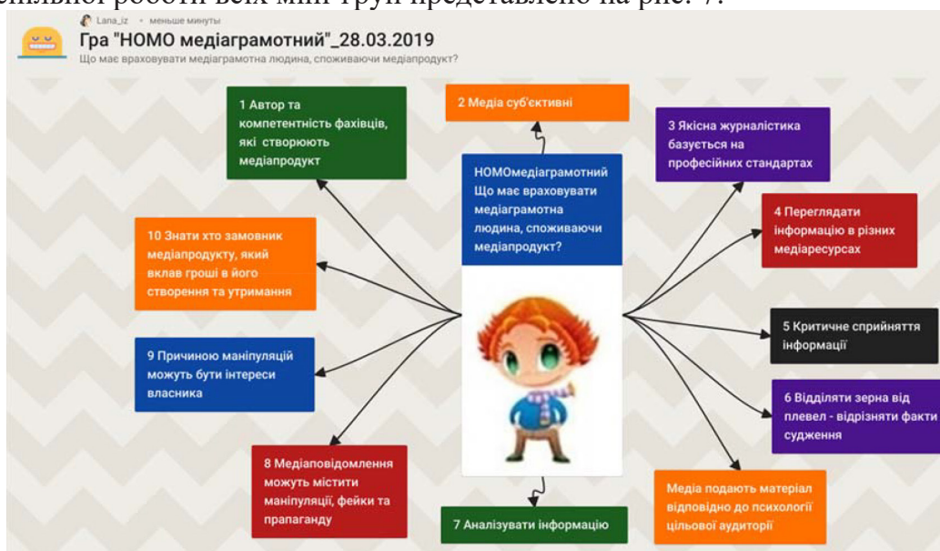
Рис. 7. Інтелектуальний продукт «Ментальна карта «Номо медіаграмотний» у середовищі онлайн дошки Padlet

Підсумком тренінгу стала інтелектуальна гра «Номо медіаграмотний», розроблена учасниками у середовищі онлайн дошки Padlet. Вчителі за допомогою стікерів створили образ медіаграмотної людини, пропонуючи відповіді на запитання: «Що має враховувати медіаграмотна людина, споживаючи медіапродукт?». Інтелектуальний продукт спільної роботи всіх міні-груп представлено на рис. 7: