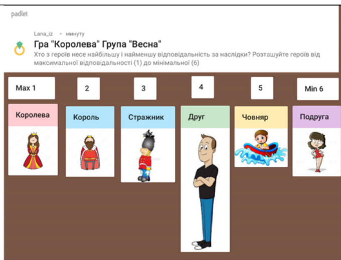
Рис. 5. Анімація до рефлексивної гри «Королева»