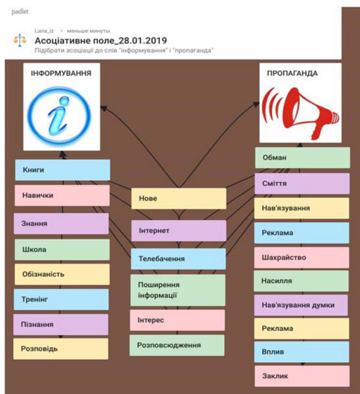
Рис. 4. Результати гри «Асоціативне поле» у середовищі онлайн дошки Padlet

Результати роботи представлено на рис. 4 [8]: