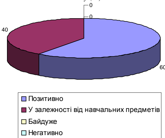
Рис. 2. Ставлення студентів до навчання у вищому педагогічному навчальному закладі після експерименту (%)

Для оцінки готовності студентів до виконання основних професійно-педагогічних функцій (операційно-діяльнісний критерій), з’ясування змін у засвоєнні професійних знань використовувались кількісні та якісні критерії, прийняті у педагогіці і психології: реальний об’єм знань у порівнянні з початковим об’ємом. Значущість і об’єм отриманих знань виявлялись за допомогою тестових питань, результатів залікових занять за окремими темами курсу і порівняння з об’ємом знань студентів до початку формуючого експерименту.