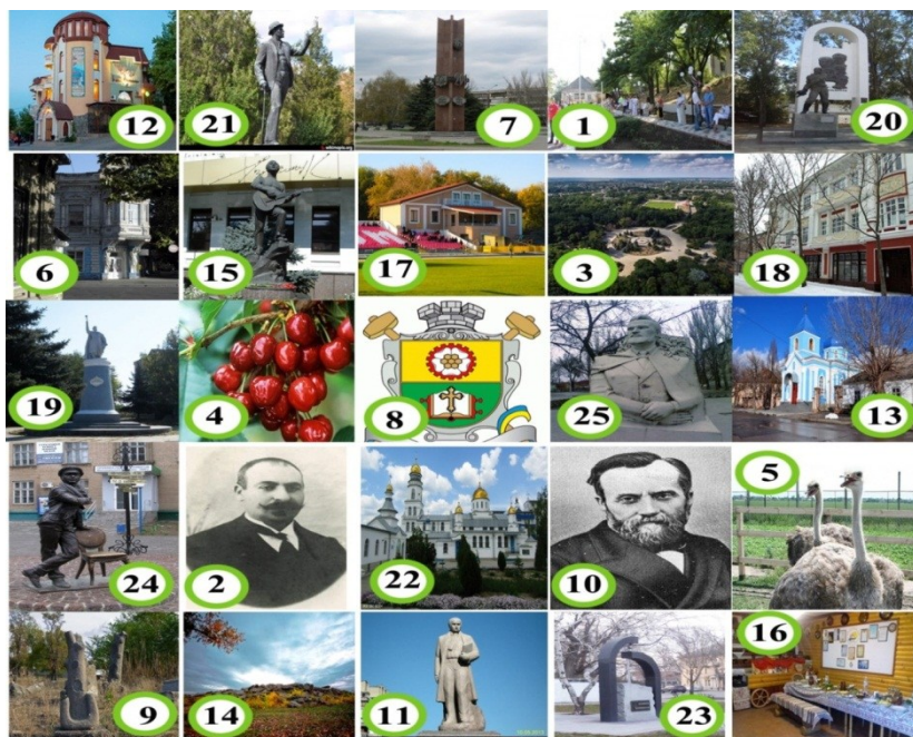
Рис. 1 Рекреаційно-туристські ресурси м. Мелітополя в таблиці Шульте

В статті реалізовано спробу висвітлити можливості застосування таблиць Шульте як одного з видів педагогічних технологій в краєзнавстві, запропонувати ряд «ресурсно-туристських опорних сигналів» (останні об'єднують архітектурно-історичну, природну, біосоціальну складові). Застосовуються для дослідження та розвитку психічного темпу сприйняття, зокрема швидкості зорових орієнтовно-пошукових рухів (що є основою швидкочитання), дозволяє розширити поле зору (широке поле зору скорочує час пошуку інформативних фрагментів текстів). Аналіз значної кількості рекреаційно-туристських об'єктів м. Мелітополя дав можливість виділити основні з них, які відповідають критеріям гетерогенності (різноманітності), значущості, контрастності (рис. 1).