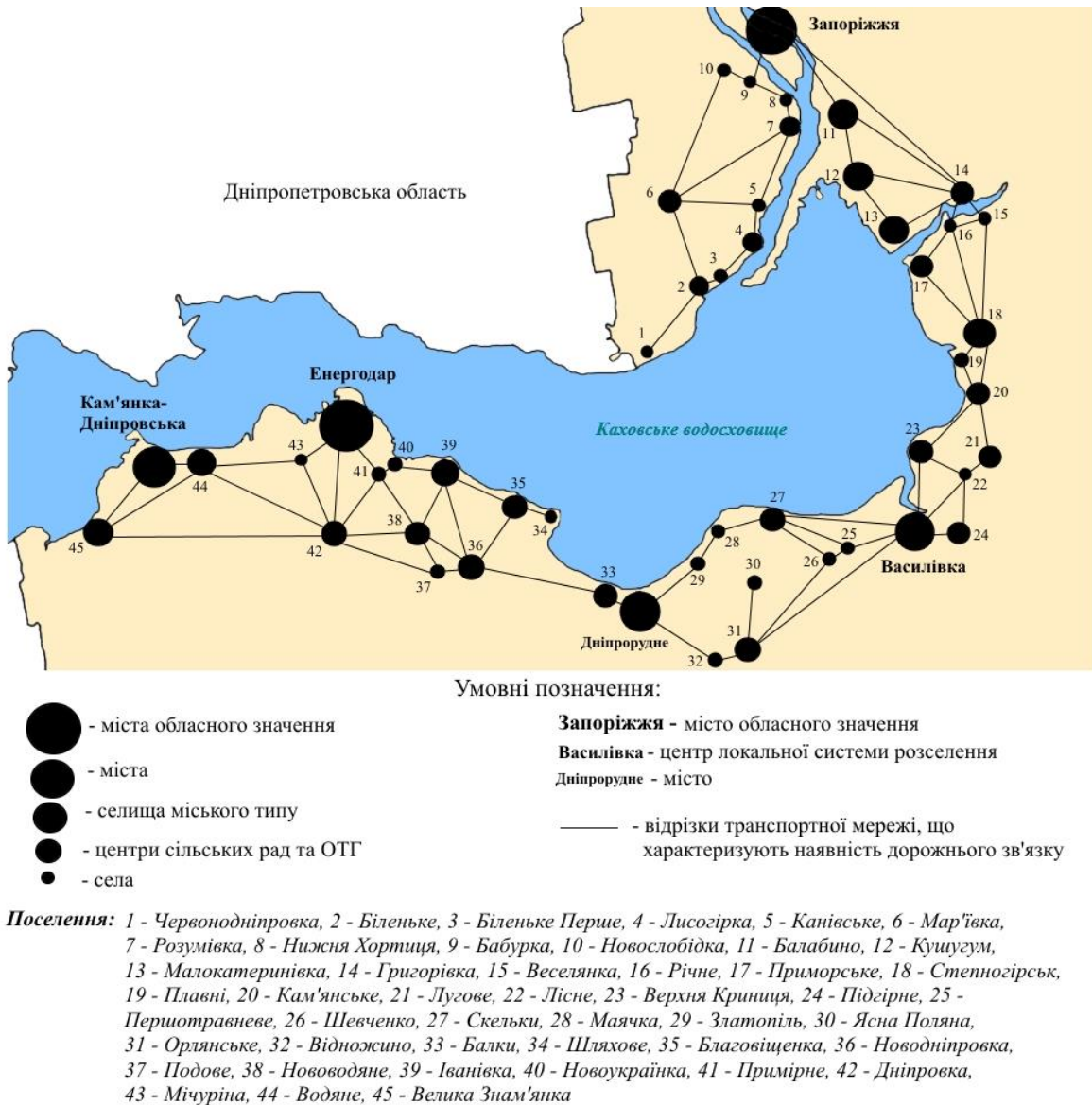
Рис. 2. Приморсько-фасадний тип розселення узбережжя

Приморсько-фасадний тип розселення, на нашу думку, характерний також і для узбережжя Каховського водосховища (Рис. 2), оскільки центри систем розселення розміщені поблизу узбережжя, а розселенські зв'язки спрямовані вглиб території.