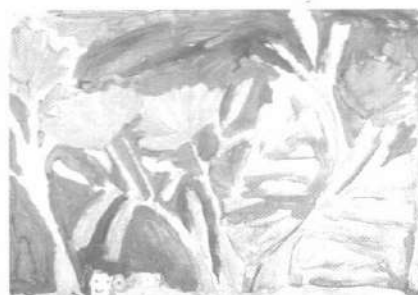
Мал. 4. Пейзаж

дітей старшого дошкільного віку Рагозіною В. В. – її елементи можуть застосовуватися і в роботі з картками: особливо це стосується використання запитань «відкритого» типу («Що відбувається на картині? Що тут ще відбувається? Що ти бачиш тут такого, що дозволяє тобі так думати?» та інше) та прийомів регування педагога на відповіді дітей (парафраз і лінкінг), що розвивають інтерес до художніх творів, бажання їх обговорювати, образно-асоціативне мислення дітей, мовленнєво-комунікативні навички [8].