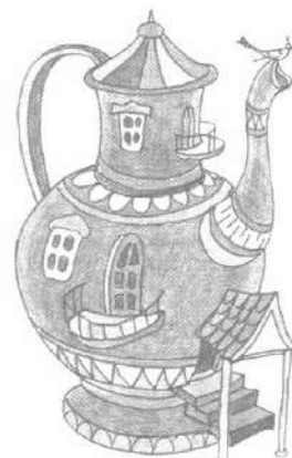
Мал. 6. Будинок