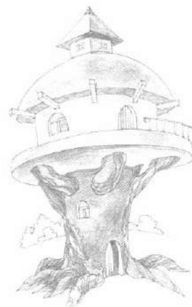
Мал. 5. Будинок

Учасники занять роздивлялися зображення різних будинків – реалістичних та фантастичних, розповідали про своє ставлення і враження від них. Педагог спрямовував обговорення запитаннями: «Який це будинок? Чи хотів би ти жити в такому будинку? Він тобі подобається (не подобається)? Чому саме цей будиночок тебе зацікавив? Чого не вистачає на цій картинці? Що можна тут доповнити (домалювати)? Хто живе в цьому будинку (хто міг би жити в цьому будинку)?» та ін. Такі картинки і їх обговорення стимулюватиме дітей на створення цікавих робіт за казками: наприклад, завдання – створи помешкання для персонажів казок « Півень та мише-