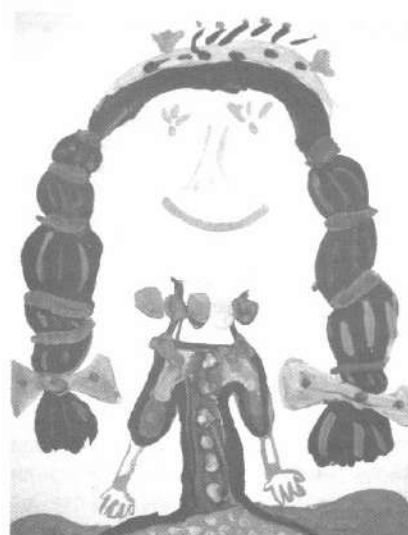
Мал. 10. Автопортрет (Поліна С., 7 р.)

Відповідно до методики на заняттях практикувалося використання одночасно з картками таких форм, як читання чи розказування казок, прослуховування музичних творів, емоційно-образна розповідь, гра-пантоміма, гра в асоціації та інші методи, що стимулювали ди-