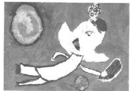
Мал. 2. Фантастичне дійство