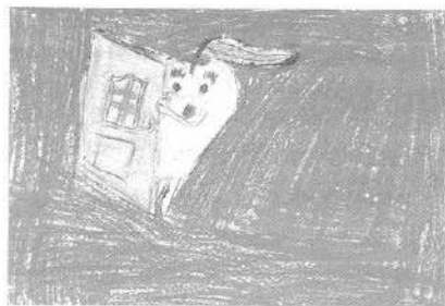
Мал. 7. Яблуко