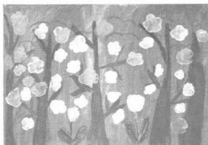
Мал. 3. Пейзаж