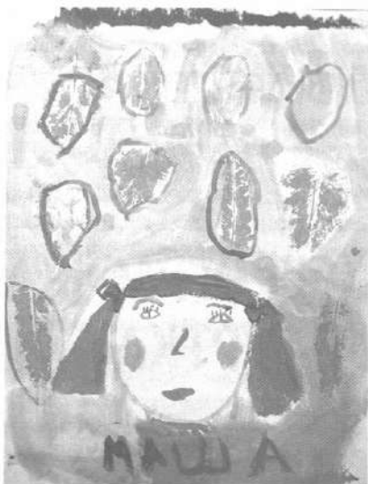
Мал. 9. Автопортрет (Маша К., 6 р.)

Кожна картка – це малюнок одного незвичайного яблука, на якому нанесені очки, рот, ніс, брови, тобто частини обличчя людини. Кожне яблуко своєю