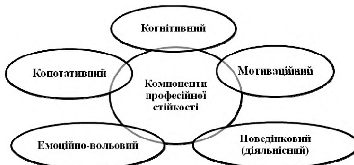
Рис. 1. Модель професійної стійкості майбутнього практичного психолога на основі акмеологічного підходу (складено автором)

У результаті теоретичного аналізу нам удалося виявити такі структурні компоненти професійної стійкості майбутнього практичного психолога (рис. 1).