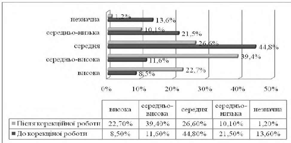
Рис. 1. Динаміка розвитку мікроклімату студентської групи до та після корекційної роботи

За результатами методики — «Оцінка мікроклімату студентської групи» (В. М. Зав'ялова), виявлено, що групова тренінгова робота сприяла підвищенню ступеня позитивного психологічного мікроклімату на 14,2 %, що безумовно підвищує прагнення студентів перебувати у даній референтній групі та сприяє активізації процесу професіоналізації.