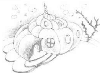
Іл. 7. Асоціативна метафорична картка "Будинок"