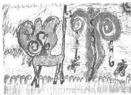
Іл. 1. Асоціативна метафорична картка "Фантастичне дійство"

Набір карток (45 карток та 44 картки відповідно), що зображують героїв, чарівні предмети і сюжети різних казкових історій. Картки допомагають зануритися у світ фантазії, отримати доступ до необмежених можливостей уяви дитини з особливими освітніми потребами.