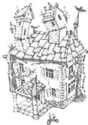
Іл. 6. Асоціативна метафорична картка "Будинок"