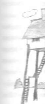
Іл. 5. Асоціативна картка "Будинок"