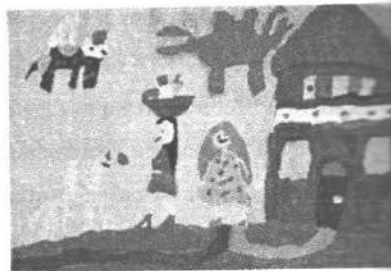
Іл. 2. Асоціативна метафорична картка "Фантастичне дійство"