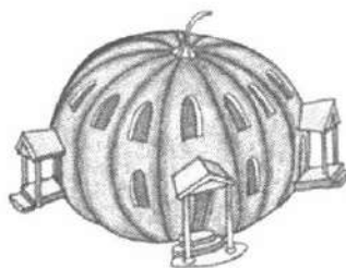
Іл. 8. Асоціативна метафорична картка "Будинок"

Зберігаючи у собі ключові особливості метафоричних карт, кожна з цих колод карток має свою специфіку і орієнтована на особливості психологічних проблем або специфічний підхід до роботи з образним світом особистості. Кожна колода унікальна, але може нескінченно комбінуватися у використанні з іншими колодами метафоричних асоціативних карток, відкриваючи нові можливості для ігор і створюючи нескінченний простір для гри нашої уяви.