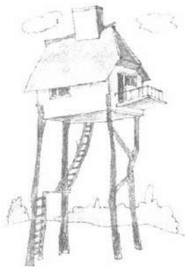
Іл. 5. Асоціативна метафорична картка "Будинок"