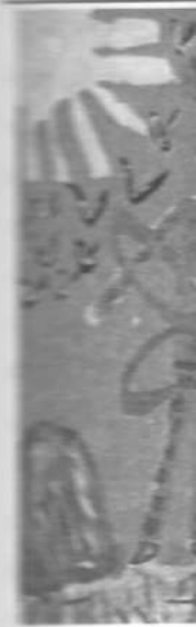
Іл. 3. Асоціативна картка "Фантастичне дійство"