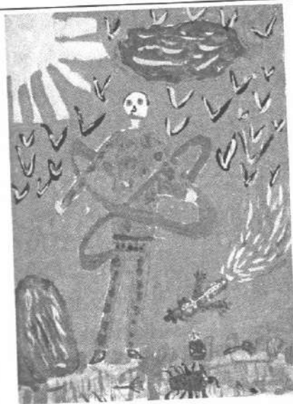
Іл. 3. Асоціативна метафорична картка "Фантастичне дійство"