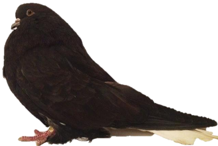
Рис. 3. Загальний вигляд голуба породи «Мелітопольські»

Сполучені нами дані показали значну морфологічна мінливість птахів породи «Мелітопольські» в місті. Нами проведений детальний опис представників породи, як доповнення до Стандарту, на елітних голубах з приватного голубника (табл.2).