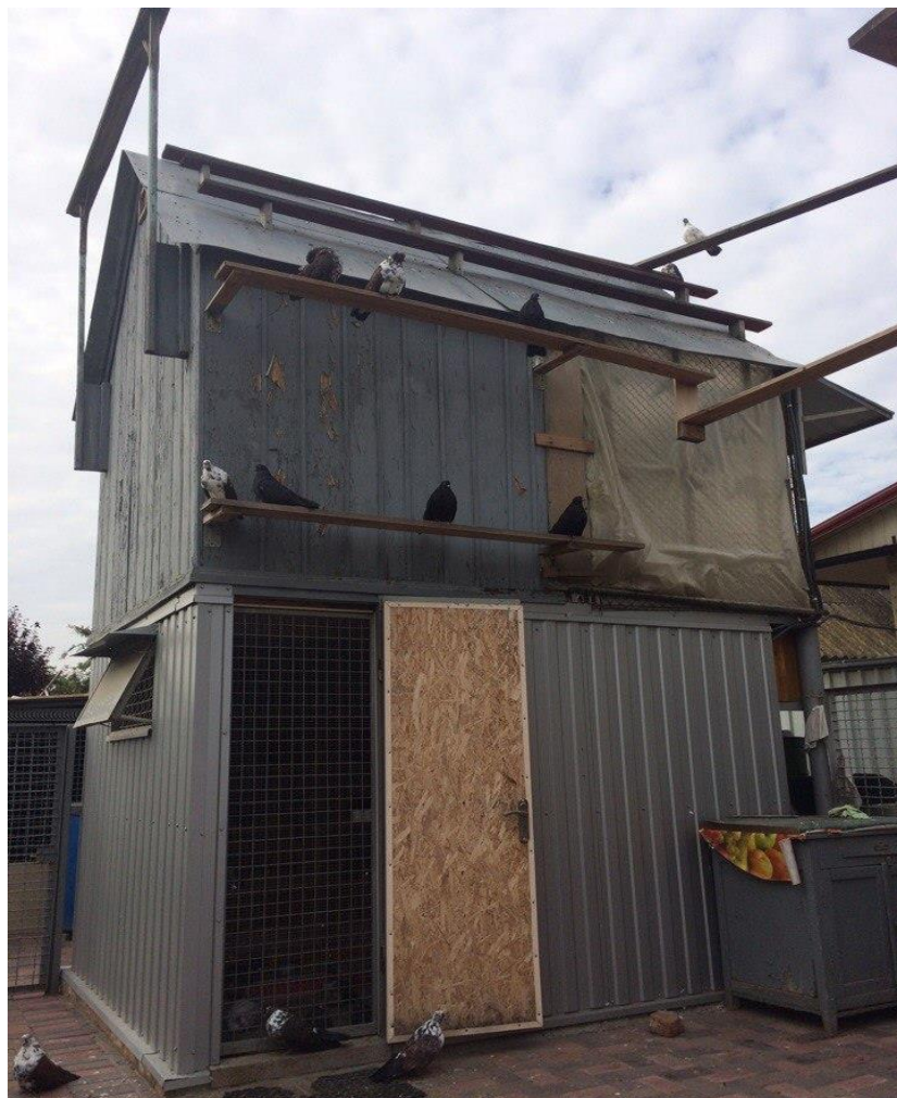
Рис. 1. Загальний вид голубника мішаного типу на стовпах та на землі.

загальноприйнятими методиками (Bondarenko, 2002; Romanov, 2012), використовувалися штангенциркуль, лінійка та пружинні терези. Щорічно були екскурсії на регіональні і міські виставки-ярмарок голубів.