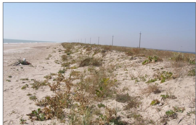
Рис. 1. Береговой литоральный вал в средней части Федотовой косы

сторону моря. В центральных частях кос отмечаются узкие участки, которые в южной части меняются значительными расширениями. Южная (верховая) часть этих аккумулятивных полуостровов характеризуется удлиненной, суженной и отклоненной на юго-запад верхушкой (на некоторых косах называются «дзэндзык»). В подавляющем большинстве рельеф кос северного побережья Азовского моря низменно-равнинный, что является определяющим фактором в формировании геохимических, эдафических и гидрогеологических особенностей местности. В микро-рельефе кос и пересыпей заметные различия восточного приморского берега от западного, которое граничит с акваториями одноименных заливов. В частности, узкая приморская полоса восточного побережья значительно выше расположена над уровнем моря и представлена литоральным валом с холмистыми формами микро-рельефа, с грядами песчано-ракушечных наносов и широкой пляжной полосой (рис. 1). Западное побережье кос характеризуется заболоченностью, вызванной низменным расположением и постепенным переходом от залива к телу косы, значительными накоплениями отложений камки и узкой прерывистой и невысокой песчано-ракушечной полосой пляжа. Центральная часть кос является низменно-равнинной, с многочисленными неглубокими впадинами, в которых формируются пересыхающие замкнутые озера и сложное кружево открытых мелководных непересыхающих соленых озер, заливов и проливов, местами с низменными островами на них [5; 16; 19; 23].