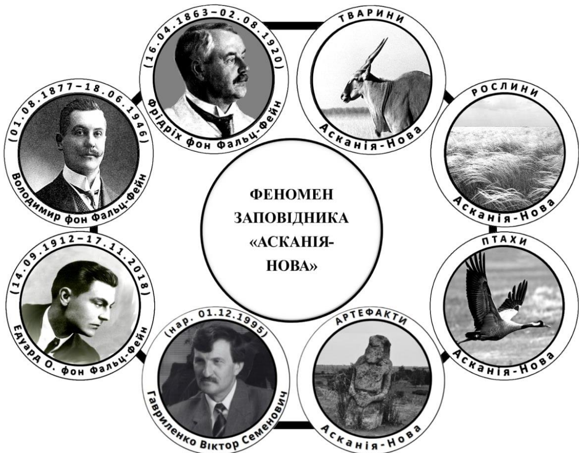
Рис. 3. Природні та біосоціальні складові феномену Асканія-Нова (О. О. Бейдик, 2024).