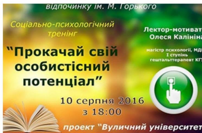
Рисунок 2 – проект за підтримки організації ФРІ «Вуличний університет».