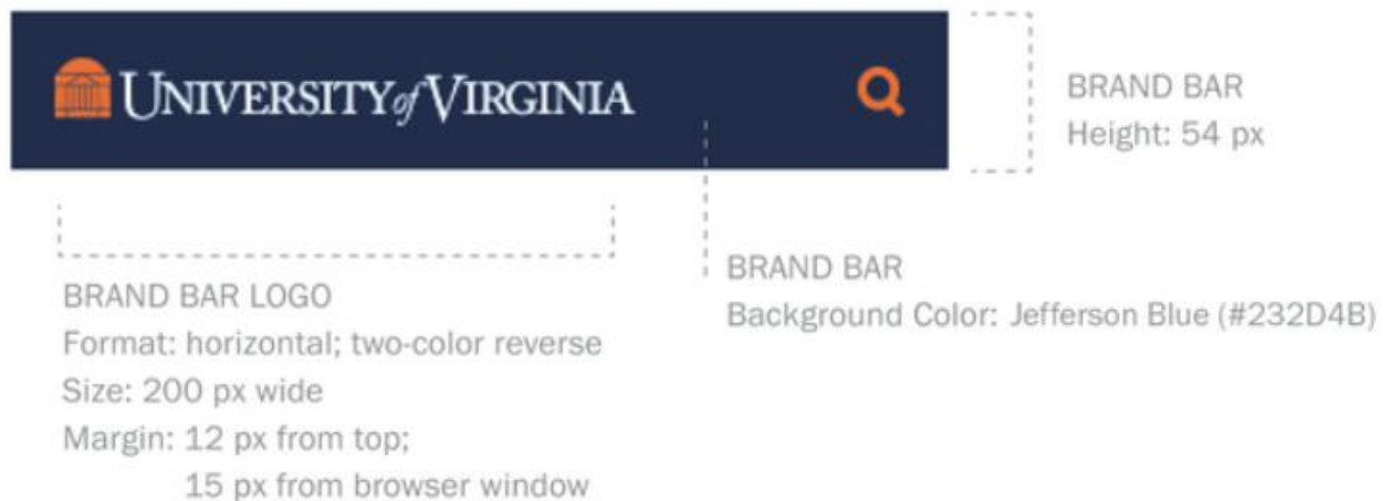
Рис. 2. Опис вимог до панелі бренду Університету Вірджинії

Зокрема опис елементів веб-дизайну містить вимоги до стилів та ієрархії шрифтів, розміщення фото на сторінці, панель бренду (Рис. 2) та пошукового рядку, заголовків, колонтитулів, панелі навігації, контактної інформації, іконок і закладок та іконографії соціальних мереж.