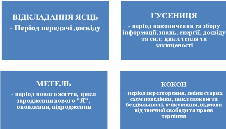
Рис. 1 Авторська модель характеристик періодів життя, станів та циклів особистості (згідно етапів гри)

Кожен гравець отримує персональні аркуші-путівники, дотримуючись яких проходить всі основні етапи гри (набір аркушів-путівників наведено в кінці цього розділу). Фішка кожного учасника виступає як індикатор гравця на ігровому полі.