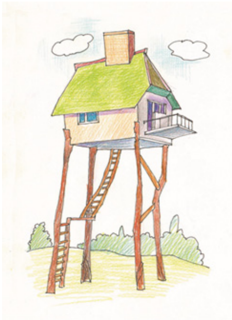
Іл. 9 (Асоціативна метафорична картка “Будинок”