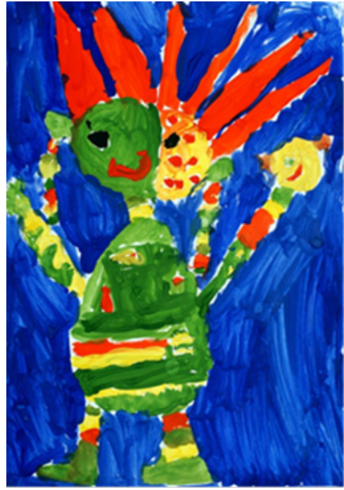
Іл. 4 (Асоціативна метафорична картка “Фантастичне дійство”