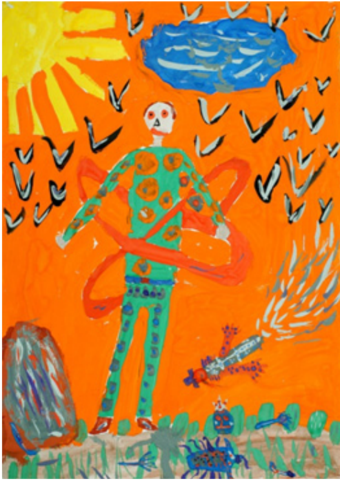
Іл. 3 (Асоціативна метафорична картка “Фантастичне дійство”