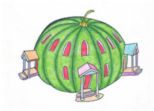
Іл. 12 (Асоціативна метафорична картка “Будинок”