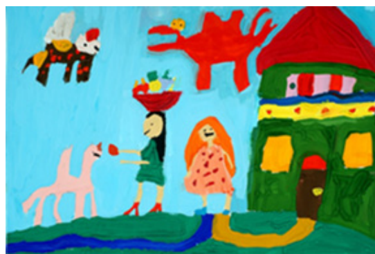
Іл. 2 (Асоціативна метафорична картка “Фантастичне дійство”)