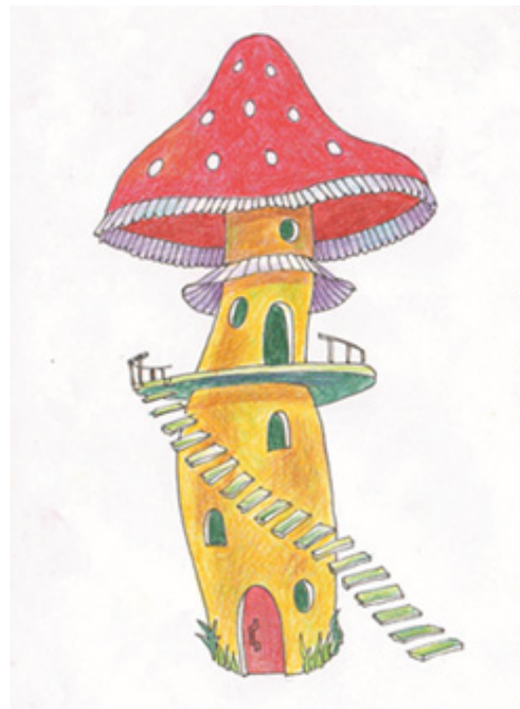
Іл. 14 (Асоціативна метафорична картка “Будинок”