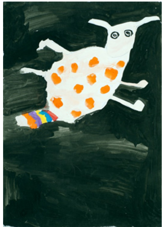
Іл. 6 (Асоціативна метафорична картка “Фантастичне дійство”