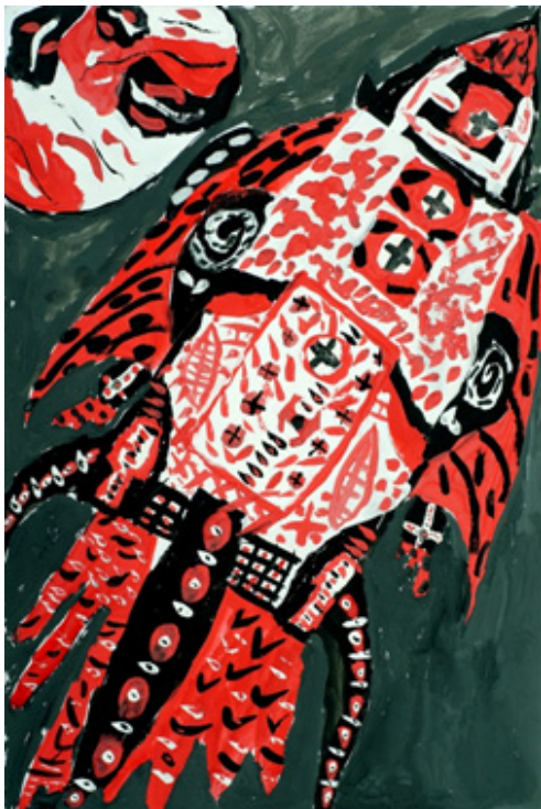
Іл. 5 (Асоціативна метафорична картка “Фантастичне дійство”