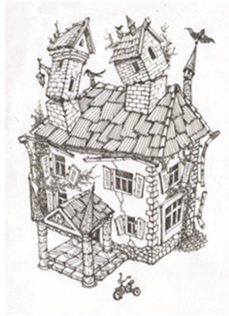
Іл. 10 (Асоціативна метафорична картка “Будинок”