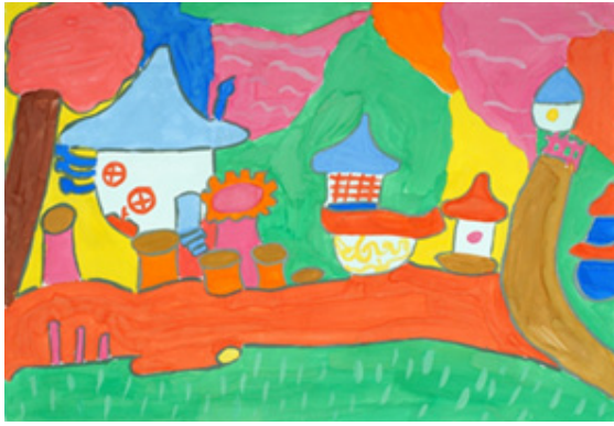
Іл. 7 (Асоціативна метафорична картка “Фантастичне дійство”