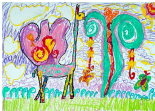
Іл. 1 (Асоціативна метафорична картка “Фантастичне дійство”)

Отже, асоціативні метафоричні картки “Фантастичне дійство” (приклади деяких карток: Іл. 1-8) , “Будинок” (приклади деяких карток: Іл. 9-16) – це барвисті малюнки у форматі А-5, що зображують героїв і події з країн і часів, яких до цього ніколи не існувало. Набір карток (45 карток та 44 картки відповідно), що зображують героїв, чарівні предмети і сюжети різних казкових історій. Картки допомагають зануритися у світ фантазії, отримати доступ до необмежених можливостей уяви дитини з особливими освітніми потребами. Зберігаючи у собі ключові особливості метафоричних карт, кожна з цих колод карток має свою специфіку і орієнтована на особливості психологічних проблем або специфічний підхід до роботи з образним світом особистості. Кожна колода унікальна, але може нескінченно комбінуватися у використанні з іншими колодами метафоричних асоціативних карток, відкриваючи нові можливості для ігор і створюючи нескінченний простір для гри нашої уяви.