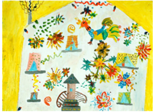
Іл. 8 (Асоціативна метафорична картка “Фантастичне дійство”