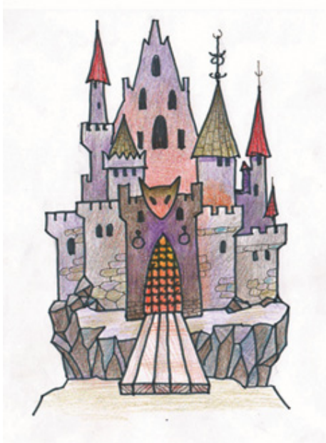
Іл. 13 (Асоціативна метафорична картка “Будинок”