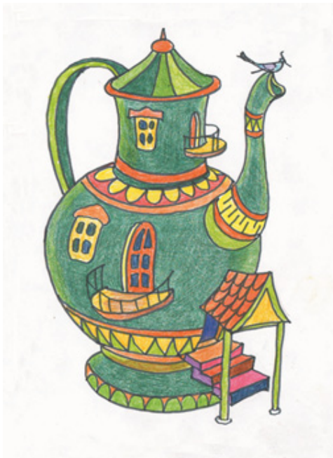
Іл. 15 (Асоціативна метафорична картка “Будинок”