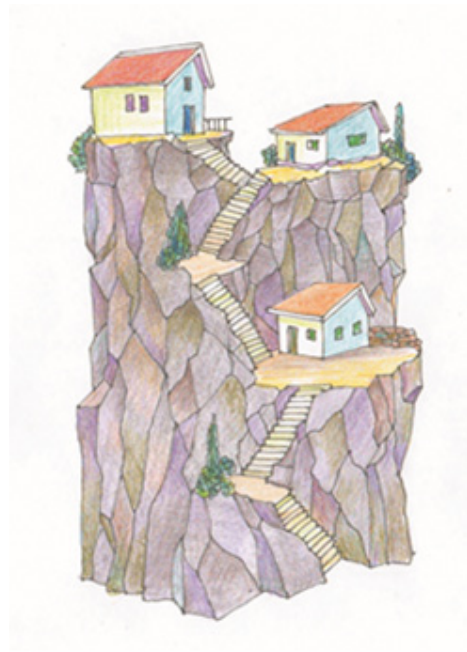
Іл. 16 (Асоціативна метафорична картка “Будинок”

Зупинимося детальніше на стандартній початковій техніці, що може бути використана при роботі з дітьми з особливими освітніми потребами (на прикладі авторських асоціативних карток “Фантастичне дійство”, “Будинок”: дитина наосліп витягує з колоди одну або кілька карток (або обирає ту, що найбільш сподобалася/не сподобалася) відповідає на наступні питання: Що зображено на карті? Хто на карті – головний герой? Чим почалася і як закінчилася ця історія? Хто ти на цій карті? Хто я? Що ця карта означає для тебе? і тощо. Переліку стандартних питань не існує, сама дитина та її відповіді є орієнтиром бесіди.