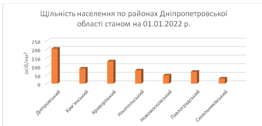
Рис. 1. Щільність населення по районах Дніпропетровської області станом на 01.01.2022 р.

Аналіз щільності населення по районах області свідчить, що її показники залежать, перш за все, від людності міських поселень на їх території. Порівняння цього показника з минулорічними даними вказує на зменшення щільності по районах в межах 1–3 осіб/км 2 . Такі зміни за один рік є доволі відчутними. Але можна передбачити, що ще більших змін цей показник зазнає внаслідок сучасного військового стану.