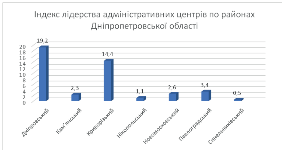
Рис. 3. Індекс лідерства адміністративних центрів по районах Дніпропетровської області

Застосування класичного підходу для визначення урбанізованості території не завжди відрізняється достатньою репрезентативністю. Наприклад, Кам'янський район (86%), де населення найбільшого міста – Кам'янського (226,8 тис. осіб) у чотири рази менше за м. Дніпро (968,5 тис.) за рівнем урбанізованості лише на 4% поступався Дніпровському району (90%), або знаходився на одному рівні з Криворізьким районом (87%), хоча поступався м. Кривий Ріг (603,9 тис.) у 2,7 рази. Ще більші диспропорції були помітні в Нікопольського (80%) та Павлоградського (78%) районах, де райцентри у дев'ять разів за людністю поступалися м. Дніпро, а за урбанізованістю відставали лише на 10–12% (табл. 1).