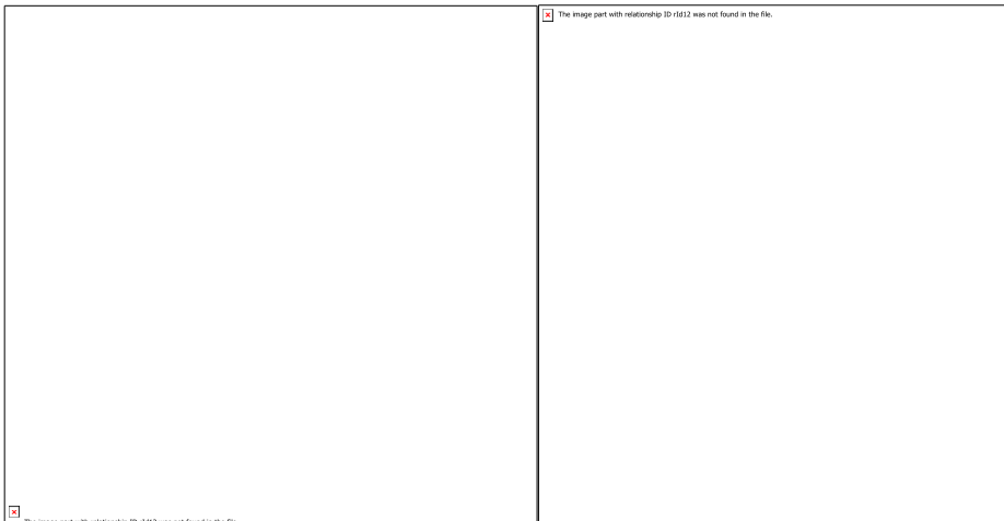
Рис. 6. Проведення трансформаційної гри «Розправ крила» з освітянською спільнотою

На постійній основі приймаємо участь в організації програми підвищення кваліфікації (експертний внесок) в «Регіональна (не) конференція для шкільних педагогів афілійований міні-EdCamp Melitopol Education Complex за темою «Саме тут...ми щасливі разом», постійно діючої педагогічної майстерні Нової української школи та інших наукових заходах з власною розробкою – трансформаційною грою «Розправ крила» (рис.6).