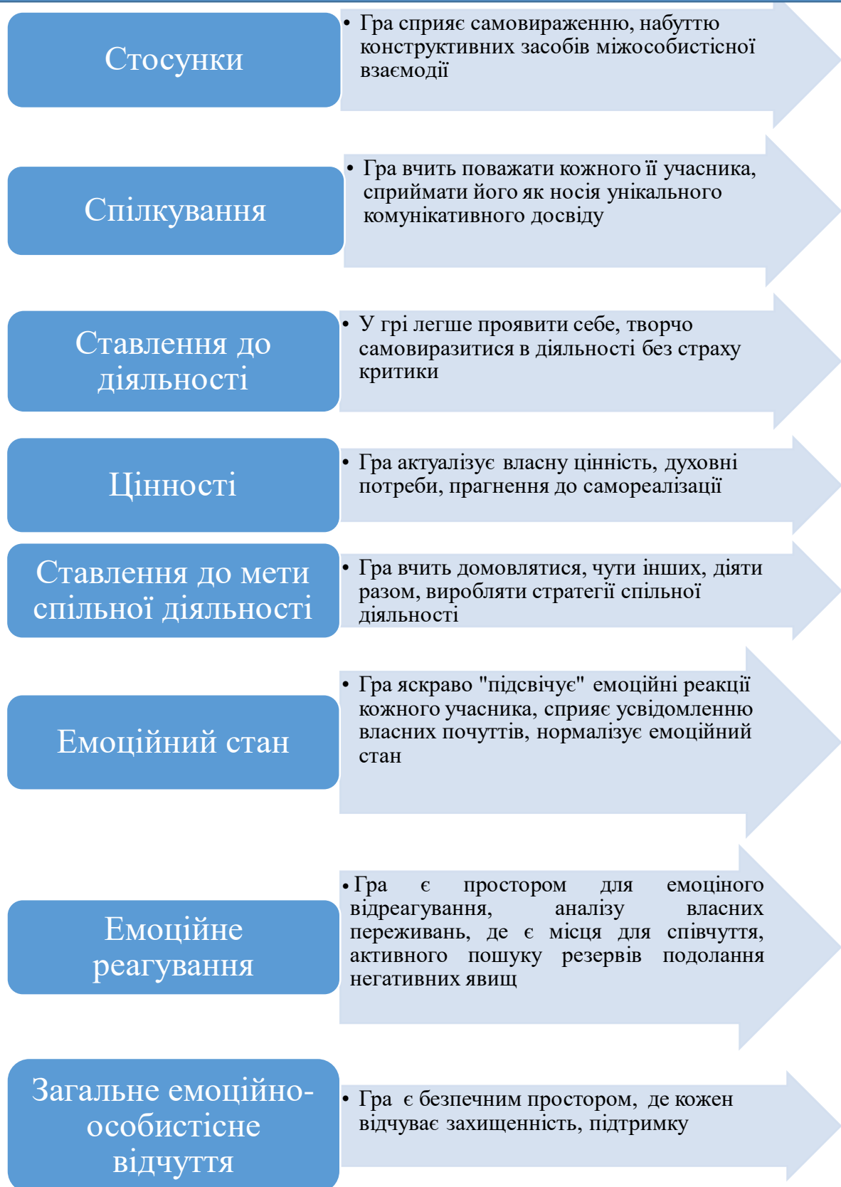
Рис. 1. Модель впливу трансформаційної гри на соціально-психологічний клімат закладу освіти