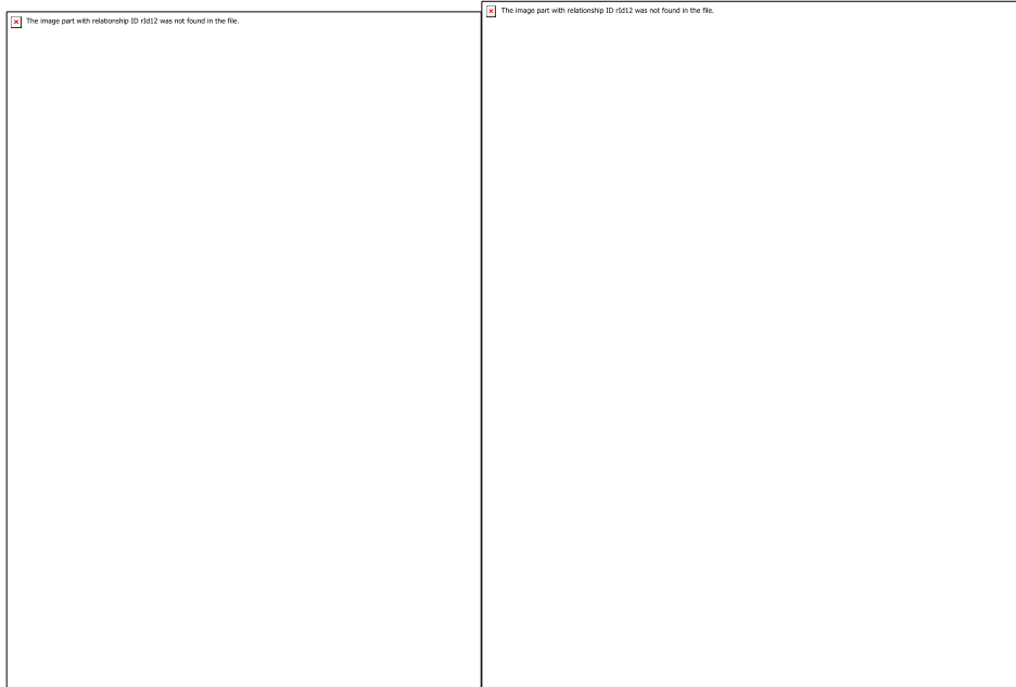
Рис. 4. Фрагмент роботи з батьками здобувачів з використанням інноваційної методики – трансформаційної гри «Розправ крила»

Впровадження трансформаційної гри при роботі з батьками актуалізує питання та проблеми, які є «болючими» у взаємостунках батьків з дітьми, батьки мають можливість проаналізувати свій досвід сімейного виховання, а сам процес взаємодії дає поштовх для подальшої співпраці (рис.4).