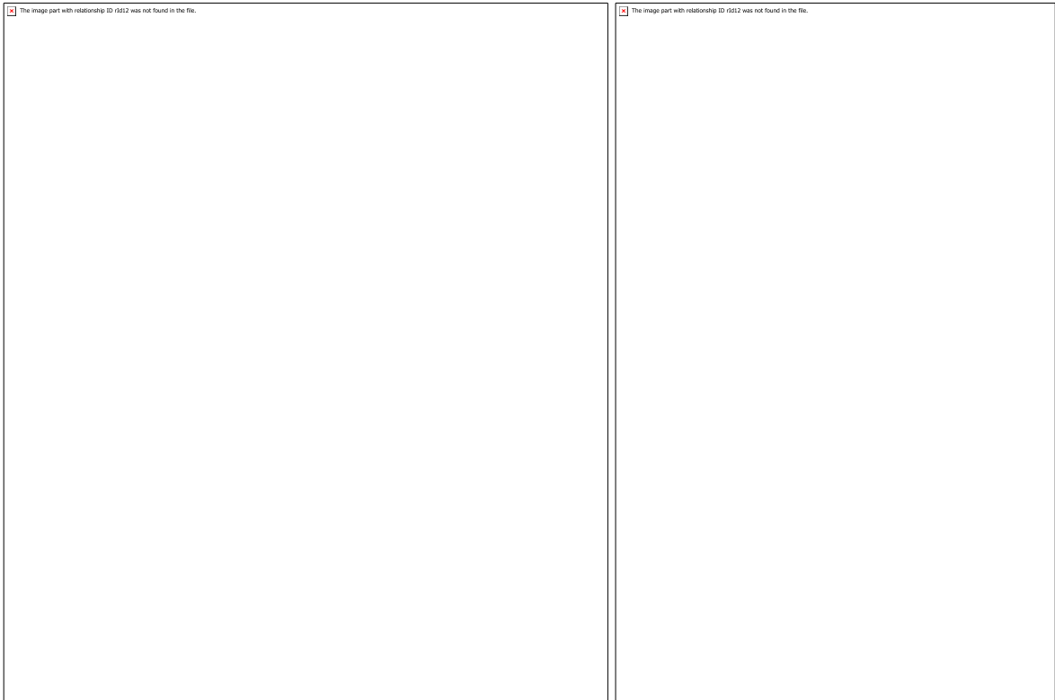
Рис.2. Фрагмент проведення трансформаційної гри «Розправ крила» із здобувачами вищої освіти

Апробація гри та адаптація інструменту до онлайн простору дозволяє ефективно організувати ігровий процес в умовах дистанційної взаємодії (рис.3.)