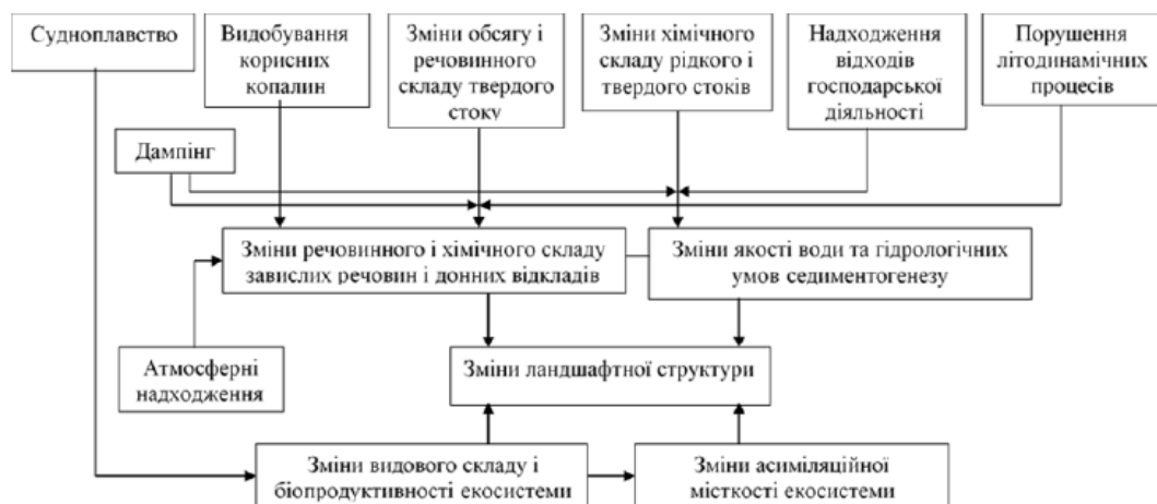
Рис. 1. Схема антропогенного впливу на акваландшафти Азовського моря

Прямі та опосередковані антропогенні фактори за останні 50–60 років визначили гідрологічний та гідрохімічний режими, біологічну і промислову продуктивність акваторії Азов-