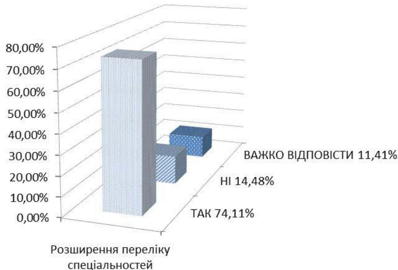
Рис. 2. Результати опитування викладачів вищих навчальних закладів щодо доцільності розширення переліку спеціальностей, згідно яких буде провадитися підготовка фахівців сфери фізичної культури і спорту в Україні

Результати опитування викладачів щодо доцільності розширення переліку спеціальностей, згідно яких буде провадитися підготовка фахівців сфери фізичної культури і спорту дають нам підстави стверджувати, що підтримують таке розширення – 74,11%; не вважають за доцільне – 14,48%; важко відповісти – 11,41 % викладачів (рис. 2).