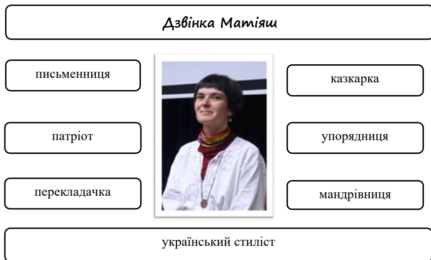
Рис. 1. Українська письменниця Дзвінка Матіяш

Відомо, що Дзвінка Матіяш – це сучасна українська письменниця, перекладачка та казкарка, яка активно пропагує художнє слово та пише твори для людей різного віку (рис. 1).