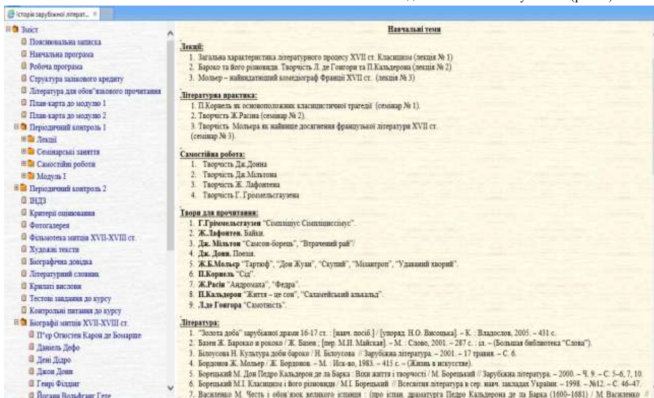
Рис. 1. Головне вікно електронного засобу навчального призначення з історії зарубіжної літератури

Так, наприклад, використовуючи на заняттях чи вдома електронний засіб навчального призначення з історії зарубіжної літератури XVII–XVIII століття можна додатково ознайомитись із відеоматеріалами, презентаціями, літературознавчим словником, пройти тестовий контроль, а також прочитати відомі крилаті вислови, біографії митців означеного періоду [11]. Це далеко не весь перелік зміст електронного підручника, оскільки обсяг його доволі значний та сучасний (рис.1).